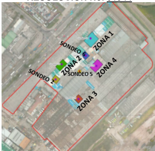
Figura 1. Áreas de intervención plan de remediación